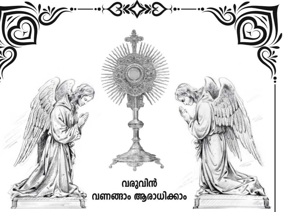
വരുവിൻ വണങ്ങാം ആരാധിക്കാം