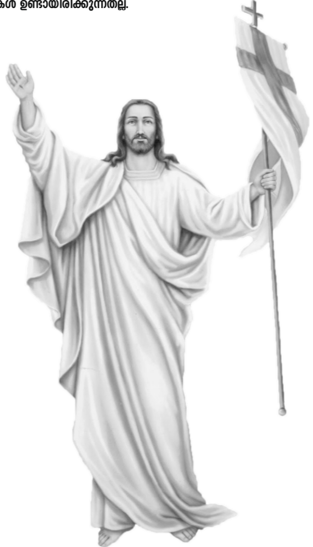
ഏവർക്കും ഈസ്റ്റർ ആശംസകൾ...